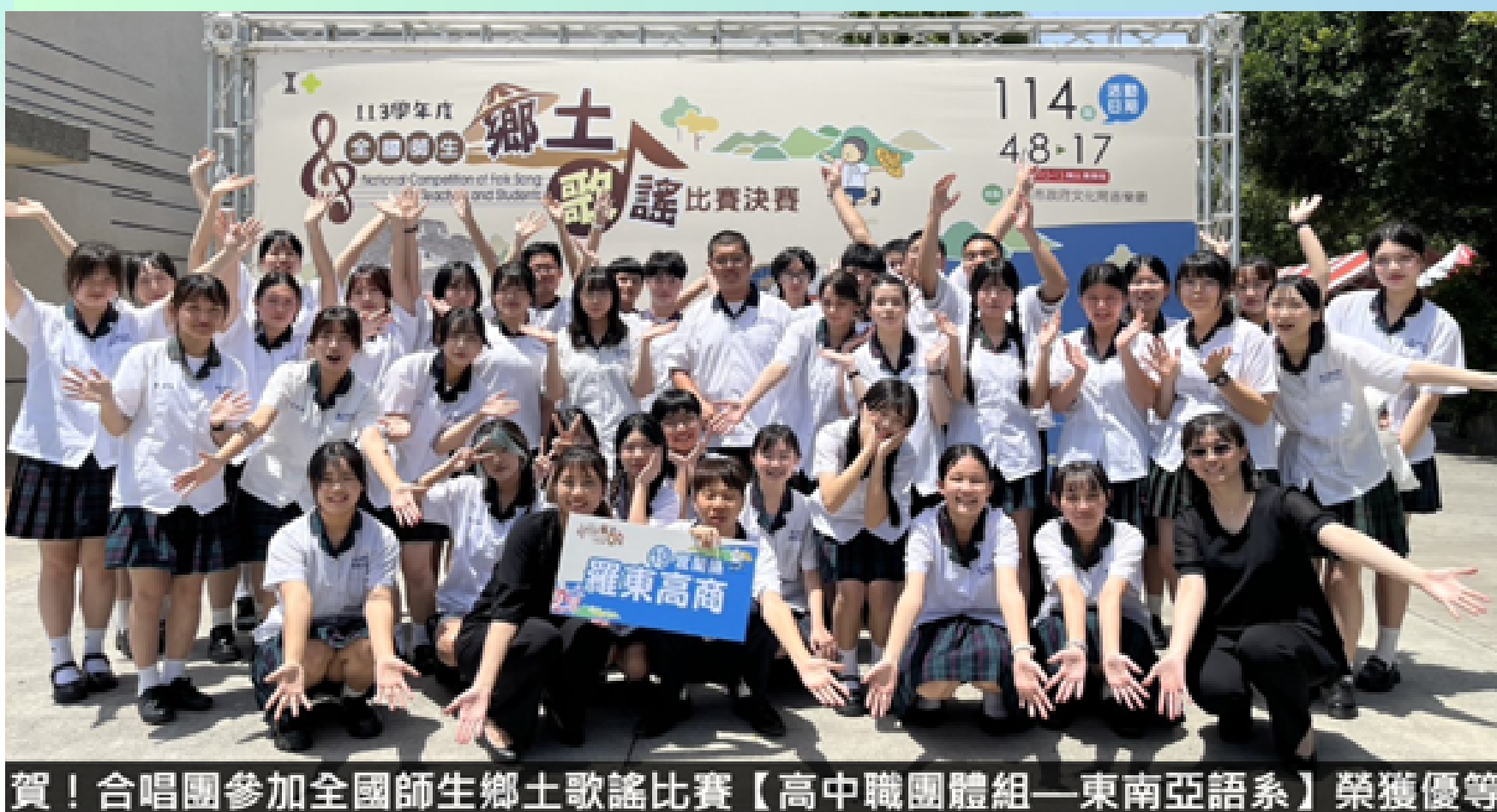
賀！合唱團參加全國師生鄉土歌謠比賽【高中職團體組—東南亞語系】榮獲優等