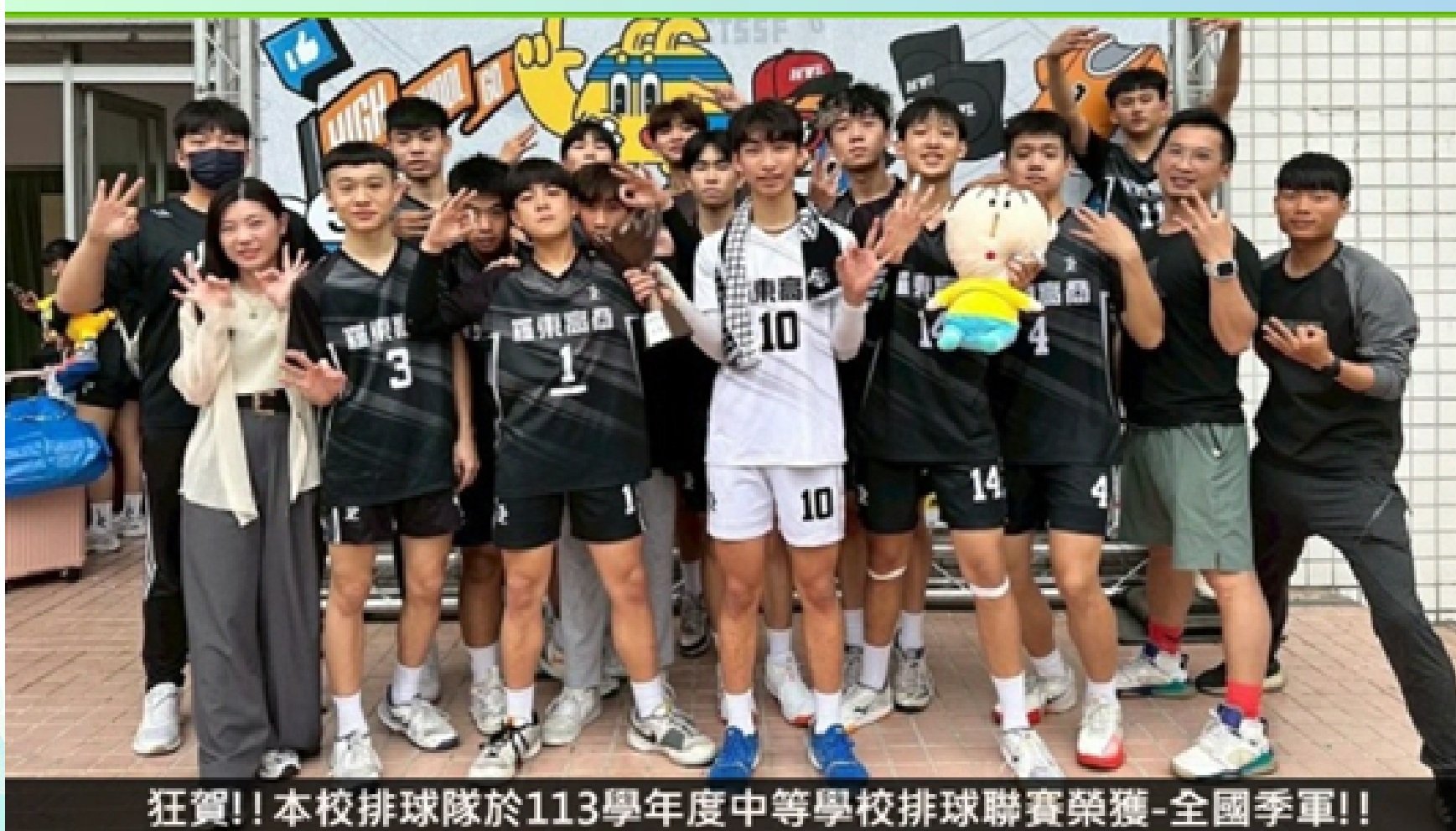
狂賀!! 本校排球隊於113學年度中等學校排球聯賽榮獲-全國季軍!!