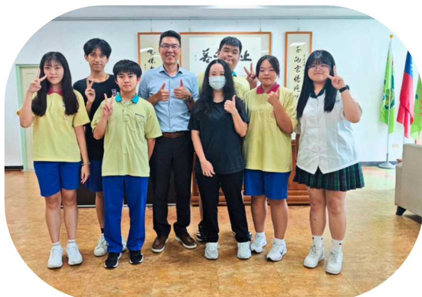
上圖為校長與訪談者合照