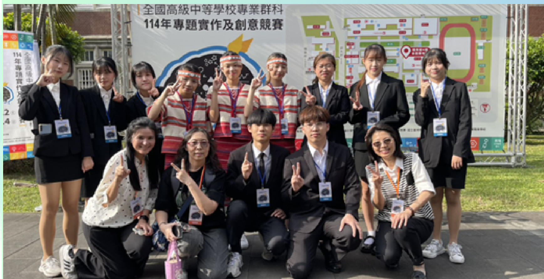
！本校參加114年全國商管群科專題及創意競賽榮獲創意組第三名、專題組佳作