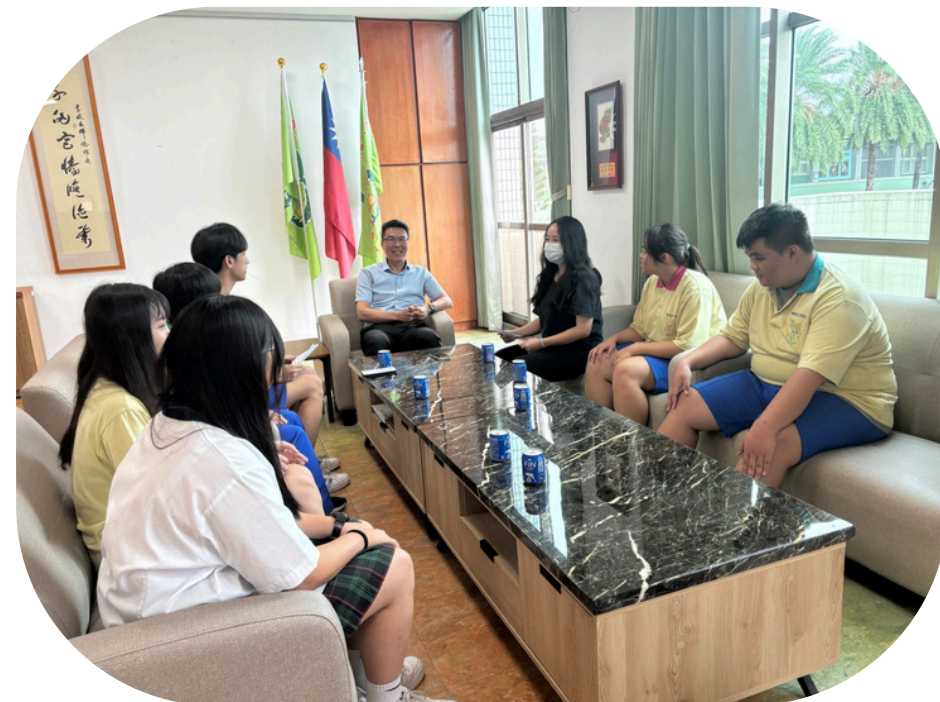
上圖為訪談中的記錄

他也解釋擔任校長的原因：「其實，不是我選羅商，而是羅商選了我。這是我的首選，剛好學校也選擇了我，所以我就有機會來這邊跟大家相處」